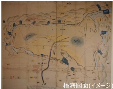
梧海図面(イメージ)