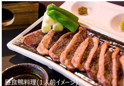
屋食鴨料理(1人前イメージ)