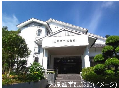
大原幽学記念館(イメージ)