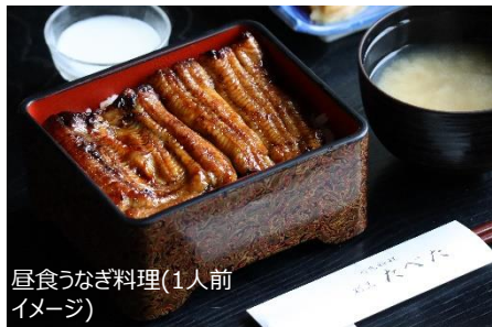
昼食うなぎ料理(1人前イメージ)