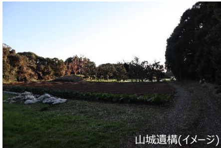
山城遺構(イメージ)